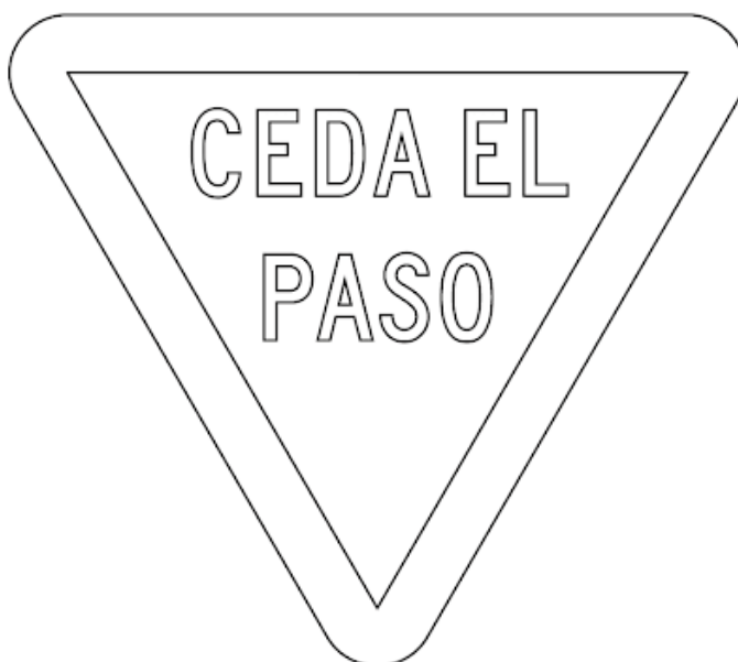
CEDA EL PASO